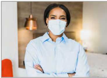
Ce que nous faisons pour vous protéger