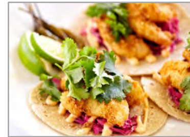
Bien manger pour mieux se rencontrer