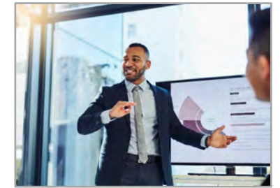
Se rencontrer d'une façon qui vous rend à l'aise