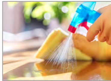
Nous avons la propreté à cœur